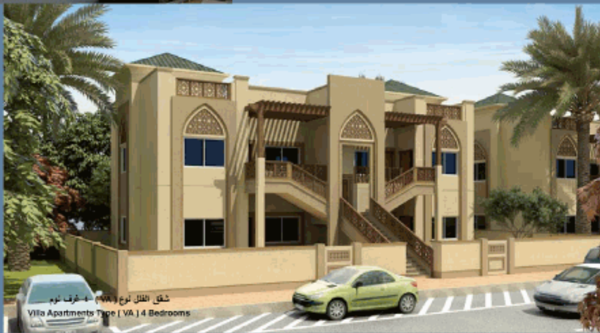
شقق الفلل نوع (VA) 4 غرف نوم Villa Apartments Type [ VA ] 4 Bedrooms

تحتوي كل طابا على أربع شقق موزعة بواقع شقتين في كل طابق توفر الخصوصية الكاملة للعائلة ، ويتوفر نوعين من الفلل بمساحات مختلفة.