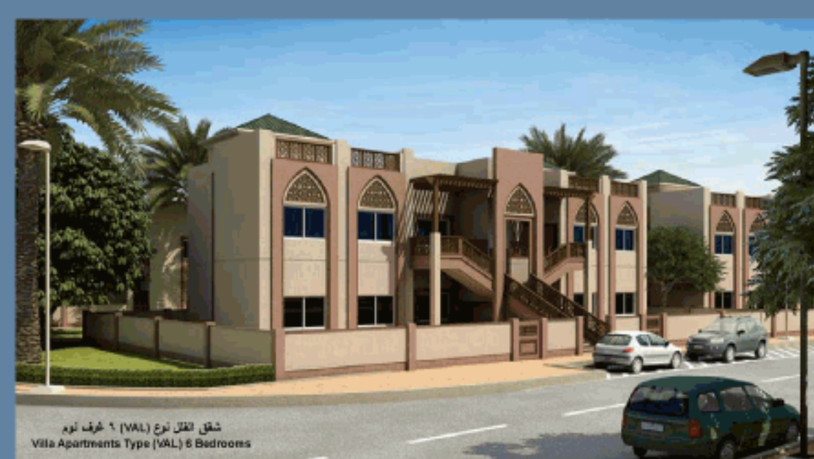
شقق الفلل نوع (VAL) ٦ غرف نوم Villa Apartments Type (VAL) 6 Bedrooms