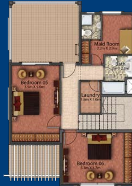
Second Floor Plan الطابق الثاني