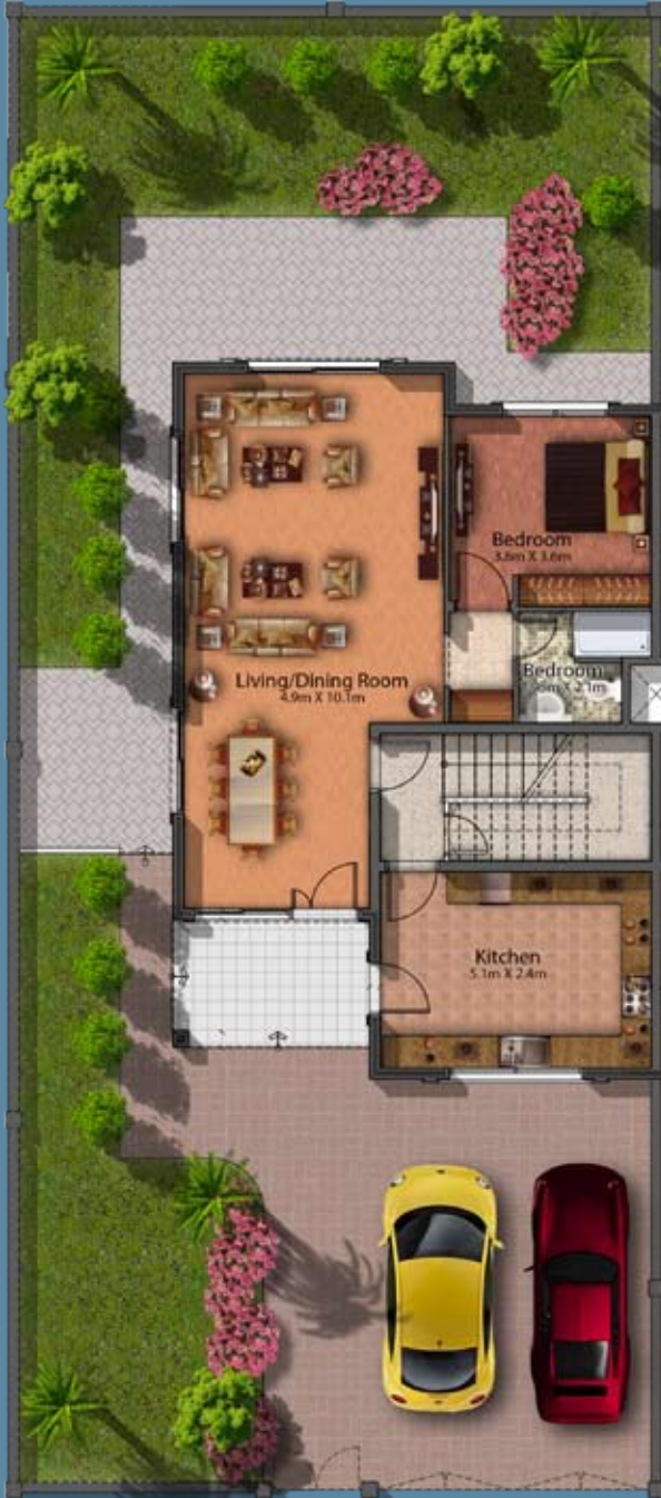
Ground Floor Plan